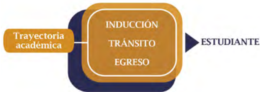
Figura 3. Fases de atención en la tutoría

Para su adecuado funcionamiento, el PIT considera las tres fases de la trayectoria escolar según el momento de la intervención, estas son: inducción, tránsito y egreso. Cada una aborda diferentes problemáticas, atendiendo las necesidades formativas a lo largo de la trayectoria escolar.