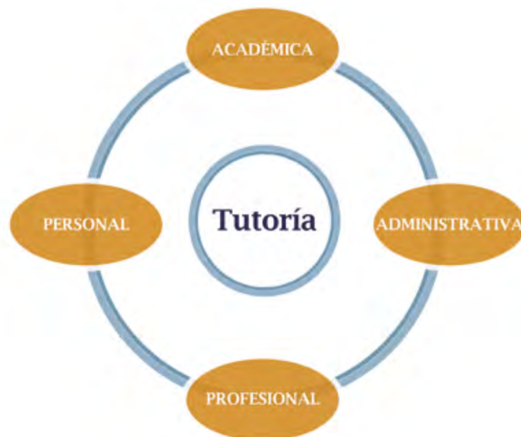
Figura 2. Áreas de atención de la tutoría

Dentro de las funciones del tutor se encuentra dar apoyo en las áreas académica, administrativa, profesional y personal: