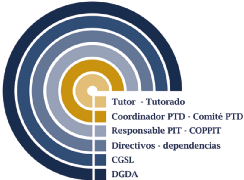
Figura 1. Actores del Programa Institucional de Tutoría

Los principales actores implicados en el desarrollo de la acción tutorial son: las autoridades universitarias de las que depende el PIT, tal y como lo es la Coordinación General del Sistema de Licenciatura (CGSL), el Responsable del PIT, el Comité Promotor del Programa Institucional de Tutoría (COPPIT), el Coordinador de Tutoría de las Dependencias de Educación Superior, el Comité de Tutoría de las DES, los tutores y los tutorados.