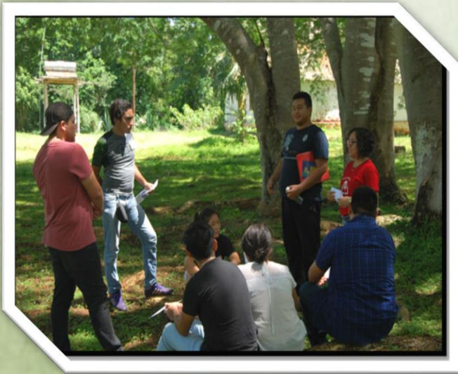
Estudiantes de la licenciatura en Historia 1° y 3° semestre, septiembre 2018

La formación integral de los estudiantes necesita privilegiar la consolidación de redes sociales que permitan generar sinergias.