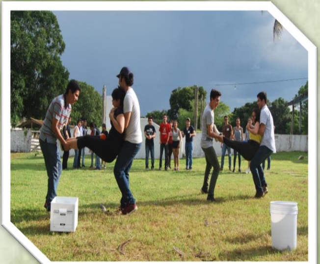
Estudiantes de la licenciatura en Historia 1 semestre, septiembre 2018

Propiciar entre los estudiantes la construcción de espacios de socialización para tejer redes. El objetivo es contribuir al éxito personal y académico individual y grupal.